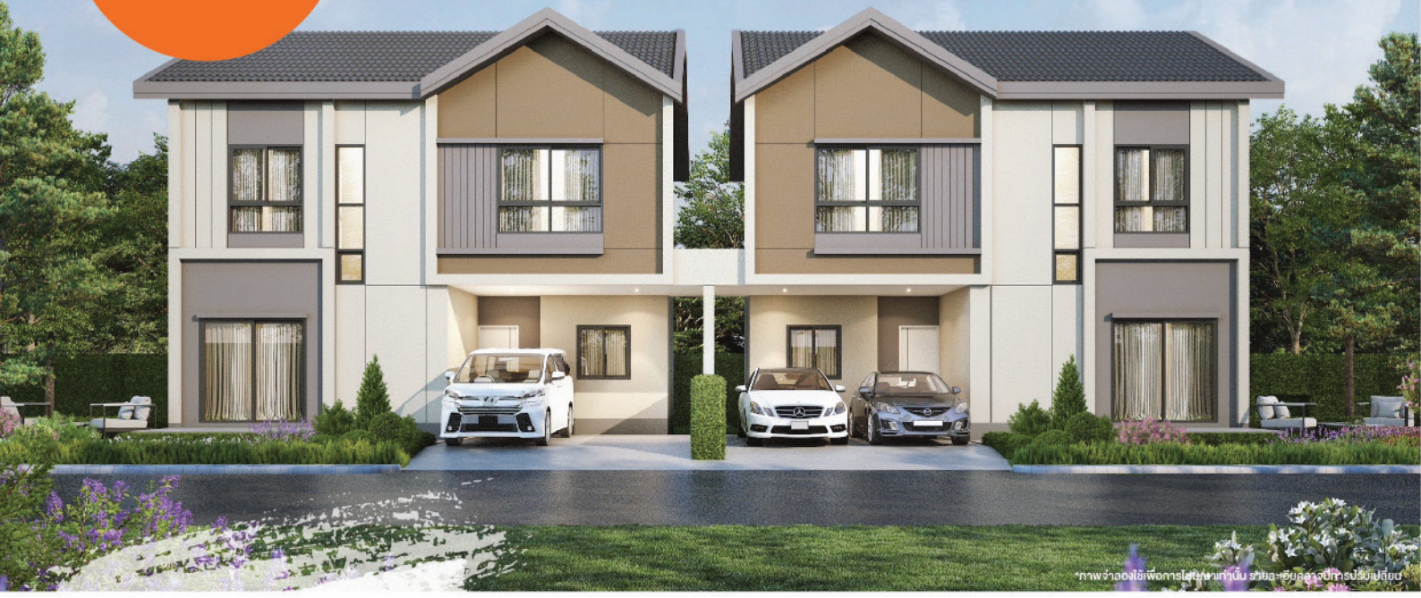
ภาพจำลองใช้เพื่อการโฆษณาเท่านั้น รายละเอียดดูจากแบบแปลน