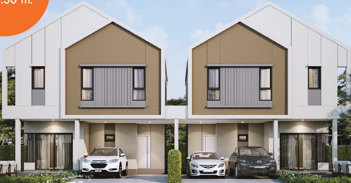
*ภาพจำลองใช้เพื่อการโฆษณาเท่านั้น รายละเอียดอาจมีการเปลี่ยนแปลง