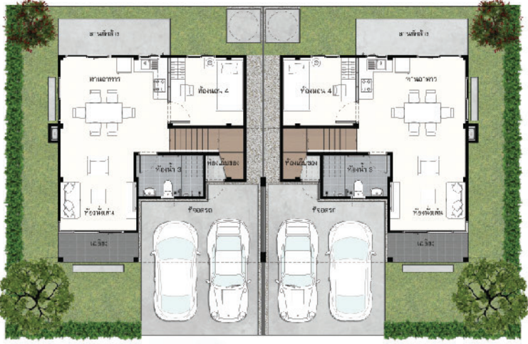
Floor 1 st