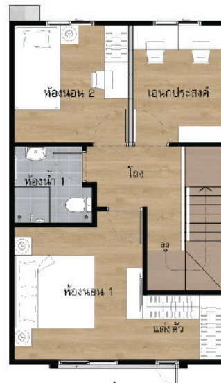
Floor 2 nd