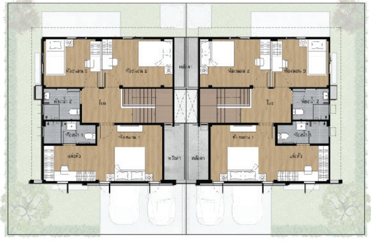
Floor 2 nd