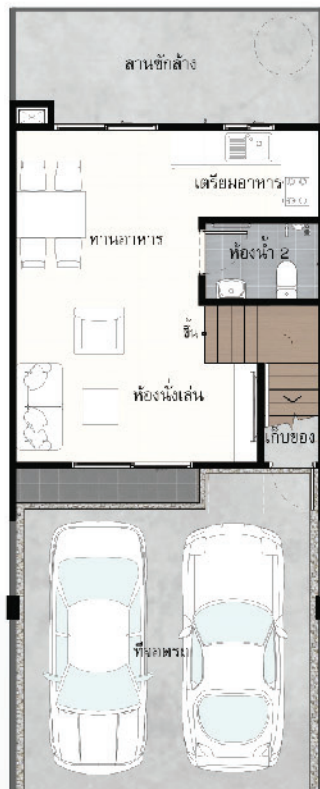
Floor 1 st

ภาพจำลองใช้เพื่อการโฆษณาเท่านั้น รายละเอียดอาจมีการปรับเปลี่ยน