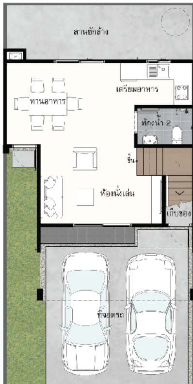
Floor 1 st

*ภาพจำลองใช้เพื่อการโฆษณาเท่านั้น รายละเอียดอาจมีการปรับเปลี่ยน