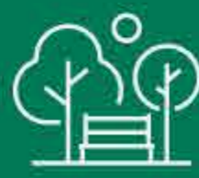
Heritage Green Park