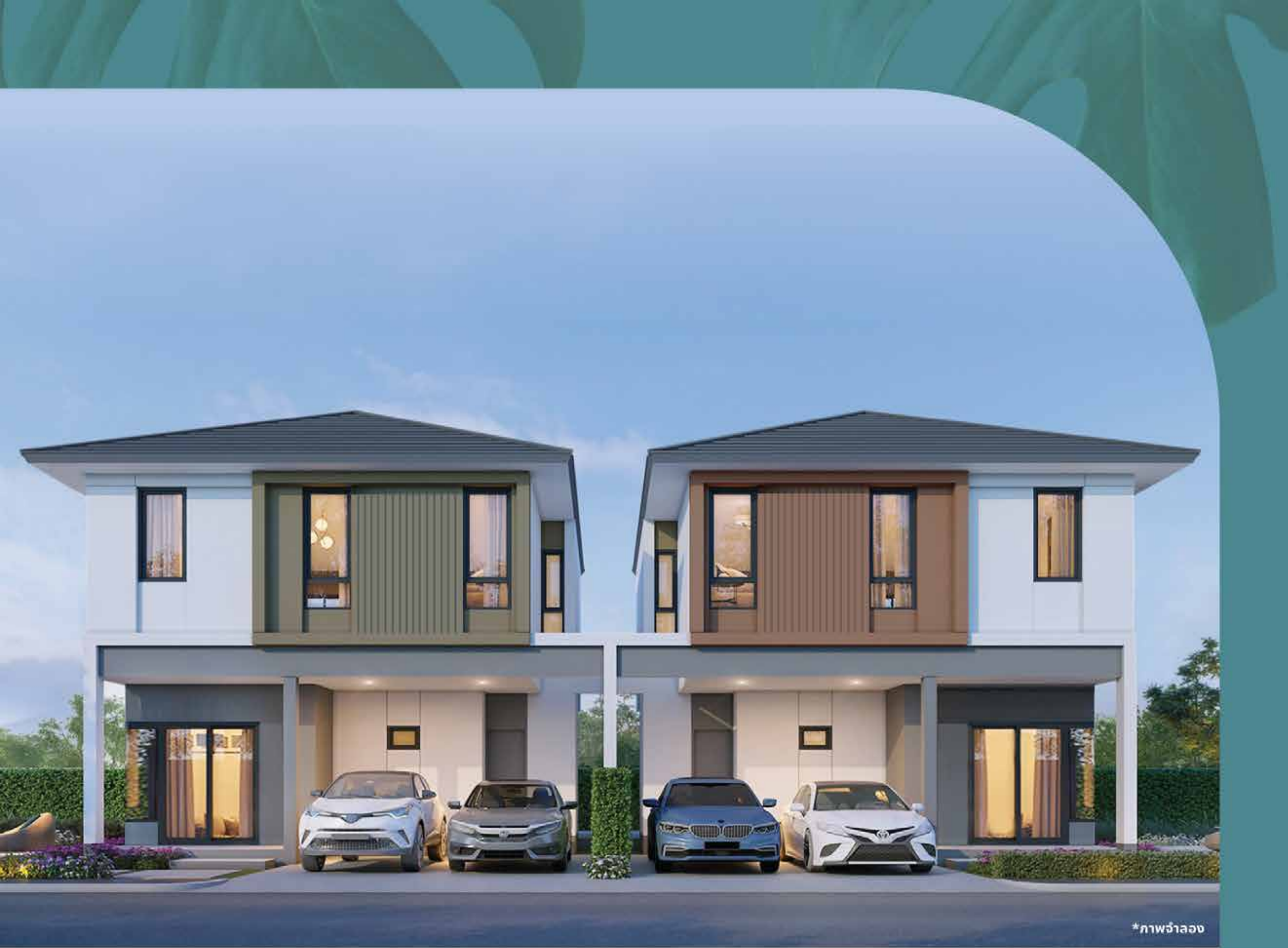
*ภาพจำลอง